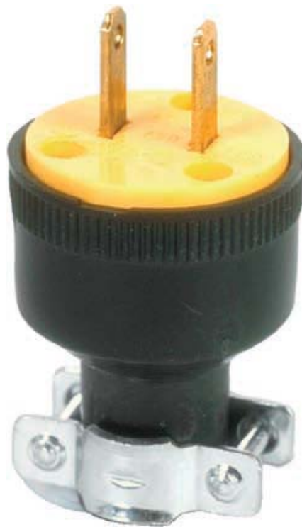
Fiche à deux broches