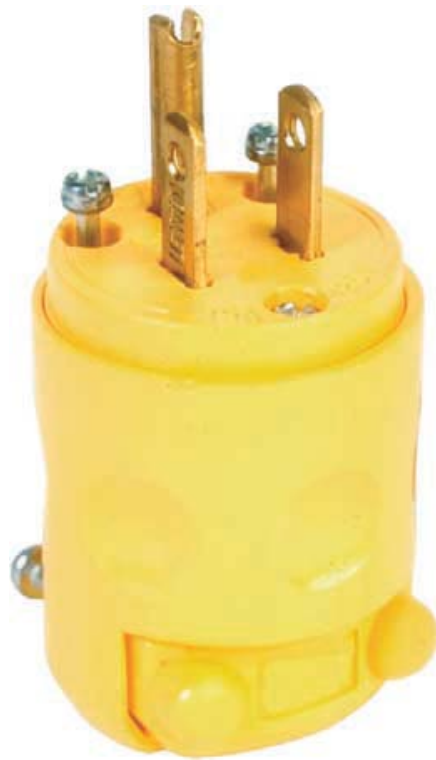
Fiche à trois broches