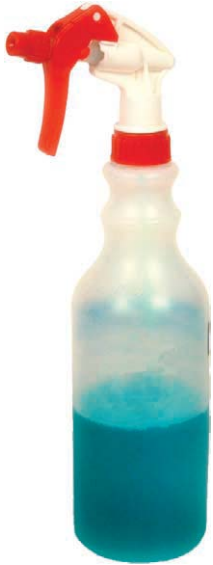
Bouteilles non étiquetée